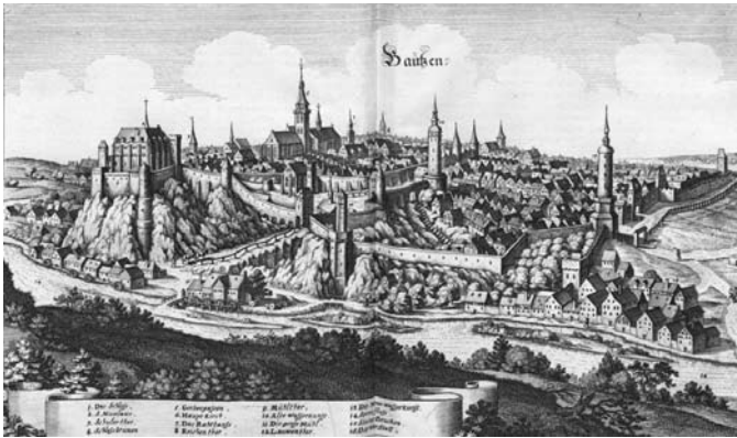
Bautzen in einer alten Ansicht

den evangelischen Gottesdienst bestimmt. Die Grenze verläuft heute noch am Lettnergitter.