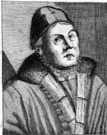
IOHANNES LEISENTRITT à Iuliusberg. Olimulio - Moravienſis . Divanus, Budifanus, et exordinationis Ferdinandi I. et con- ſeſſione Zachariae Delphini Legati Pontificis Romani, Adminiſtrator Episcopatus Almonſis per utramque Moraviam ab A. 1592. Nebst dem

Johannes Leisentritt, hier in der Schreibweise „Leisentritt“