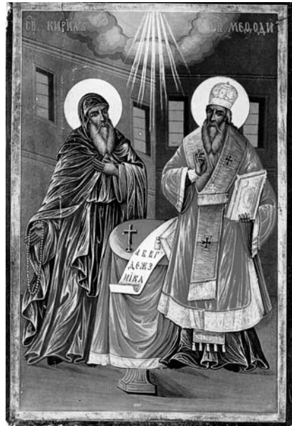
Cyrrill und Method Bulgarische Ikone des 19. Jahrhunderts.

Zur Ruhe kamen die beiden Brüder aber nicht, denn Kaiser Michael III. hatte eine neue Mission für sie. Der Fürst von Mähren, Rastislaw, schickte nämlich im Jahre 862 folgende Nachricht an Kaiser Michael: „Da sich unser Volk vom Heidentum abgewandt hat und sich nun an das christliche Gesetz hält, haben wir keinen Lehrer, der uns in unserer Sprache den wahren christlichen Glauben erklären könnte. Sende uns daher, Herrscher, einen Bischof und einen solchen Lehrer, der unserer Sprache mächtig ist. Denn von euch geht in alle Länder stets ein gutes Gesetz aus.“ Hier muss betont werden, dass Mähren eindeutig zum Jurisdiktionsbereich des weströmischen Gebietes