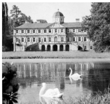
Schloß Favorite, Rastatt