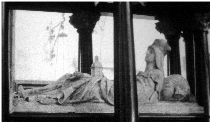
Das barocke Hochgrab der heiligen Herzogin Hedwig ist ein vielbesuchter Wallfahrtsort in Schlesien

Ende 2005 jährte sich zum 40. Male, dass die deutschen und polnischen Bischöfe am Ende des Zweiten Vatikanischen Konzils ihren Briefwechsel der nationalen Versöhnung austauschten. In ihrer Grußbotschaft an ihre deutschen Amtsbrüder vom 18. November 1965 hatten alle polnischen Bischöfe, darunter auch der spätere Papst Karol Wojtyła als Erzbischof von Krakau, festgestellt: